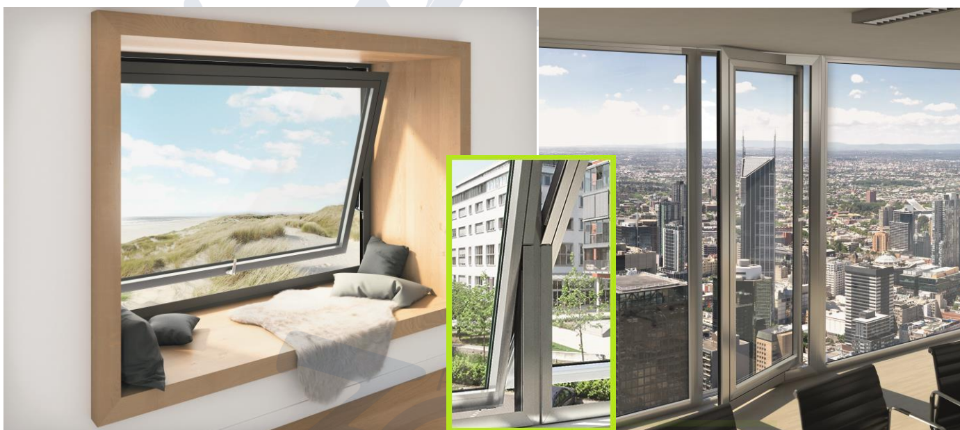
Hoja Pivotante Horizontal