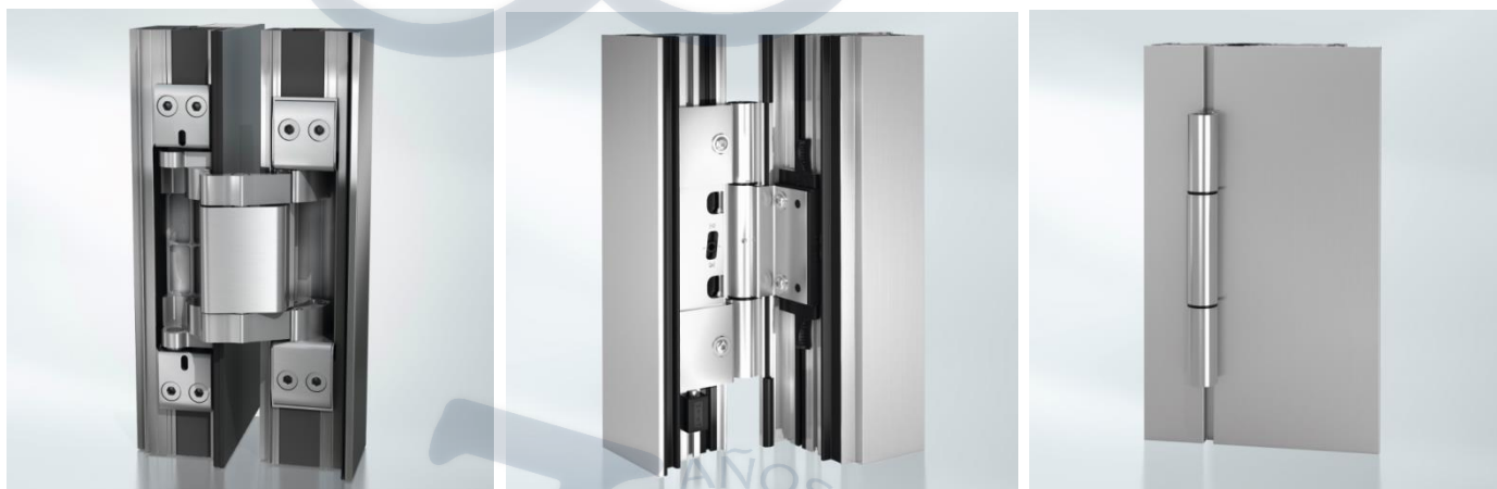
Bisagra Oculta 180° de apertura

En la planificación de la puerta de entrada se puede elegir entre tres variantes: para una apariencia intachable sin herrajes visibles, la primera opción son las bisagras completamente ocultas.