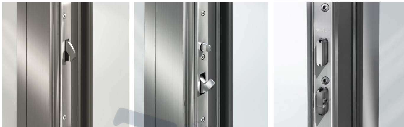
Cerradura con Ganchos de Giro

El programa de seguridad de Schüco incluye cierres con 1, 3 y 5 puntos de cierre, de forma que se puede elegir el nivel de resistencia al robo de la puerta según los deseos personales de seguridad. La protección de una puerta frente a los intentos de robo depende principalmente del tipo de cierre y del número de puntos de cierre.