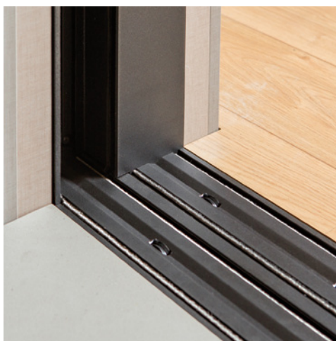
Marco externo integrado en la mampostería del edificio

Schüco – Soluciones de sistemas para ventanas, puertas y fachadas