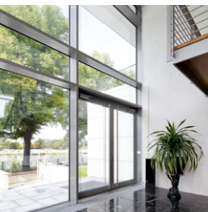
Sistema di porte Schüco in alluminio ADS 65.NI Schüco Aluminium door system ADS 65.NI